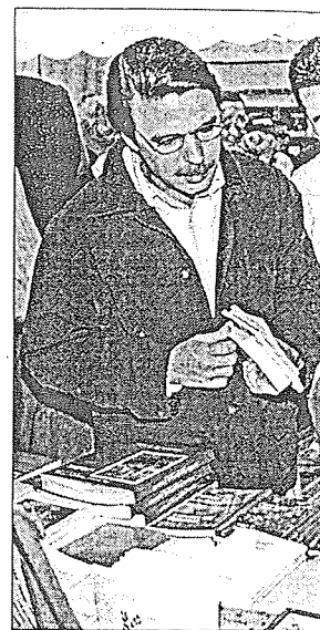
Aznar y Loyola de Palacio visitaron la Feria

Para Anguita, en el 99-99 por ciento de los casos, cuando se alega razón de Estado para no investigar un asunto, en realidad se hace para ocultar a un sinvergüenza, y emplazó a toda la sociedad, especialmente a los medios de información, a combatir este fenómeno, que está poniendo de relieve el retraso de nuestra democracia.